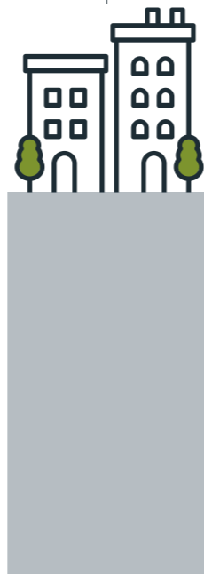
L'Orée de Trouville Résidence premium livrée en 2018